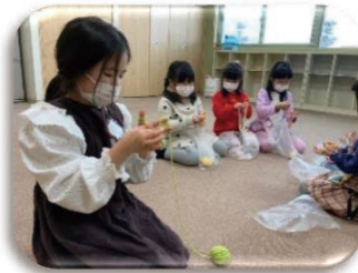
年長さんのゆび編み