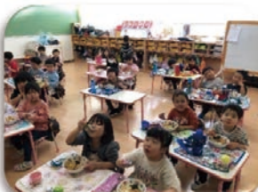
食べる時はお話ししないよ!