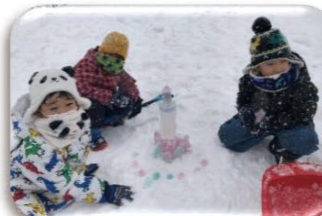
楽しいがいっぱい