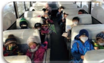
静かなバスの中。今日もたくさん遊んだね。うとうとしてしまう時もあるよ。